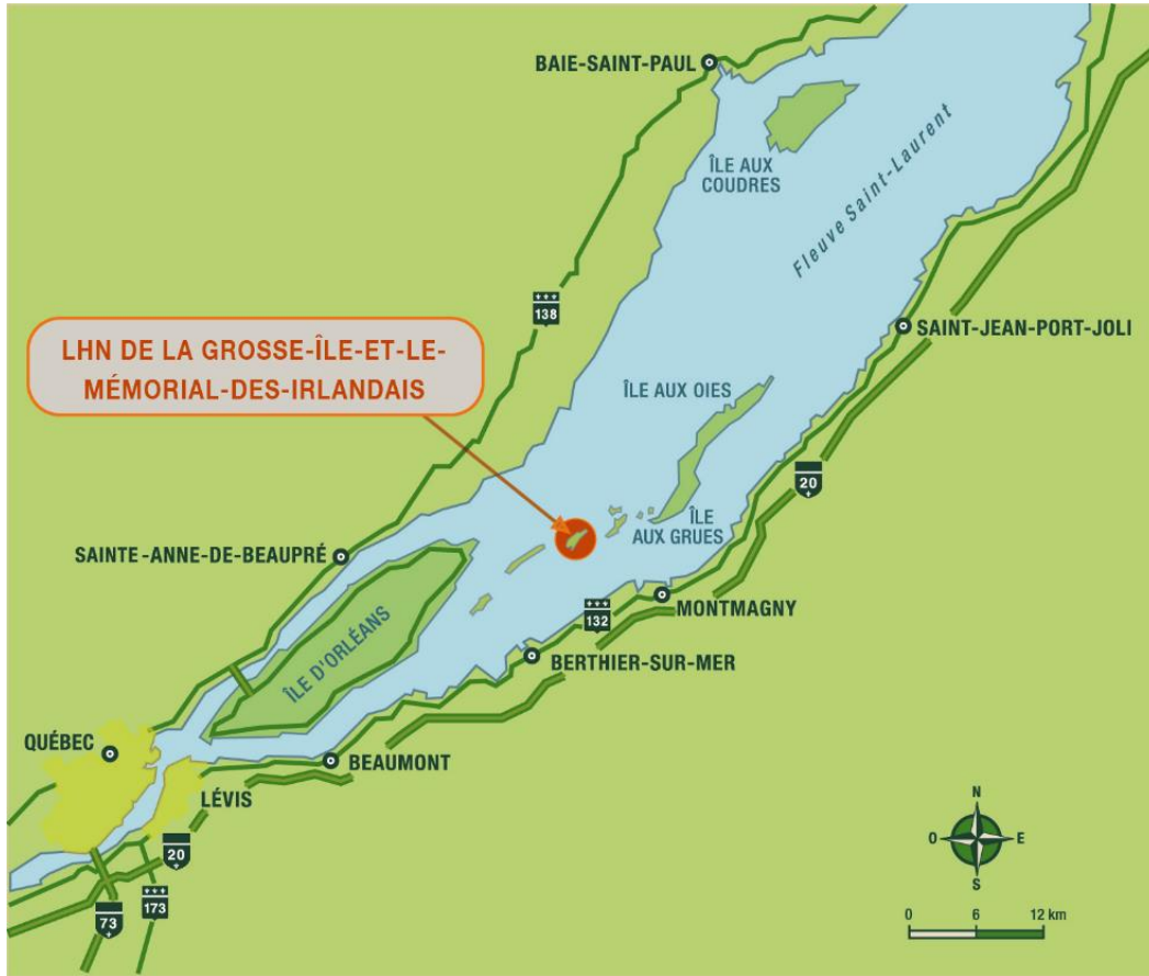
Carte 1 : Carte régionale